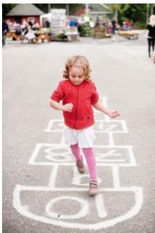
Bild: Vår arbetsmiljö påverkar hur vi mår och hur vi presterar.

Det gäller naturligtvis också för våra barns skolmiljö. Folkhälsa inom det här området handlar om att skapa bästa möjliga förutsättningar för att ta till sig